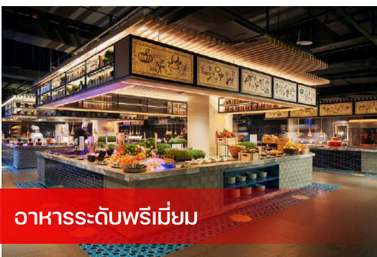
อาหารระดับพรีเมียม