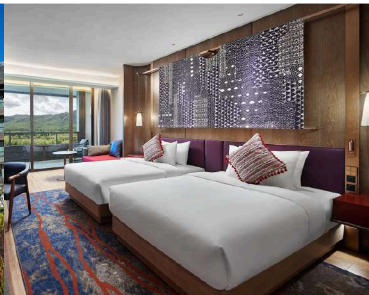
ห้องพัก Deluxe Room with View