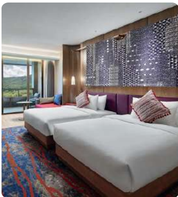
พักคลับเมดทุกคืน