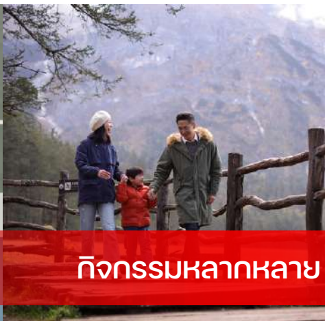
กิจกรรมหลากหลาย